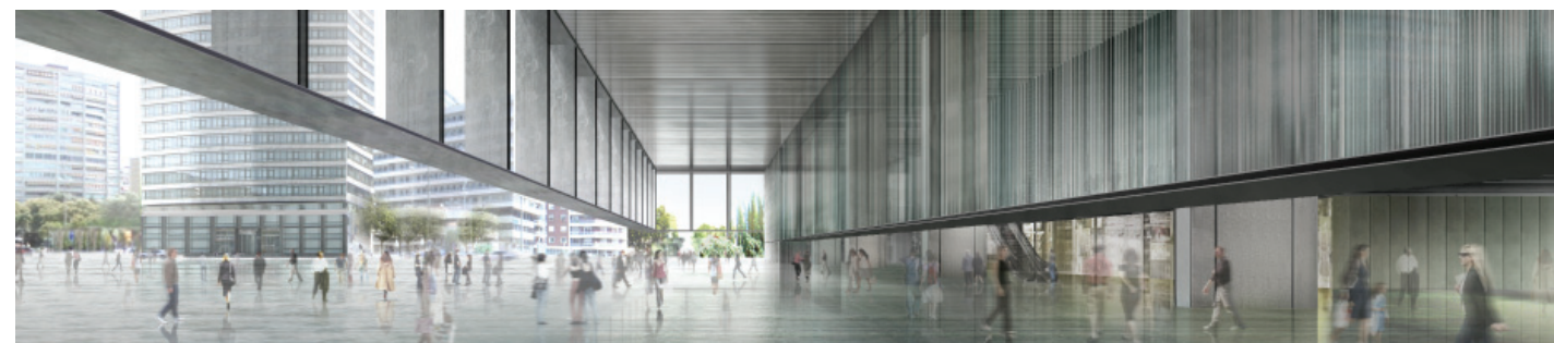
Revestimiento chapa inox perforada RCR Arquitectes. Ampliación y mejora de la estación de Sants © RCR Arquitectes